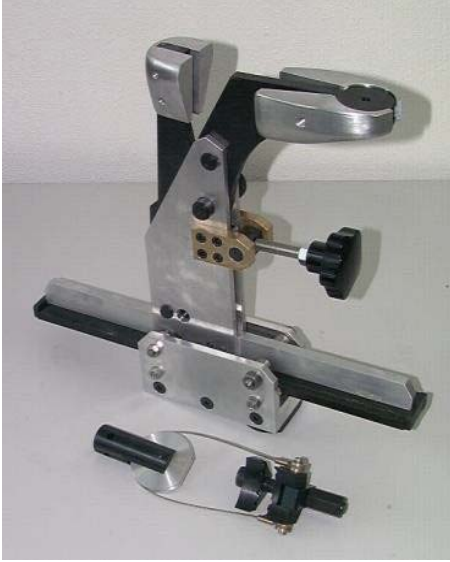
SP-V-H 3055 Serisi