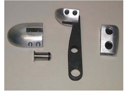
Çocuk bedeni için 3055/2